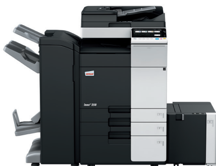
ineo+ 258 cu alimentator de hartie dualscan (DF-704), finisher capsare/brosurare (FS-534SD), caseta de hartie de mare capacitate (LU-302) si caseta de hartie (PC-410)