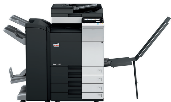
ineo+ 258 cu alimentator de hartie dualscan (DF-704), inisher capsare/brosurare (FS-534SD), tava banner (BT-C1e) si caseta de hartie (PC-210)