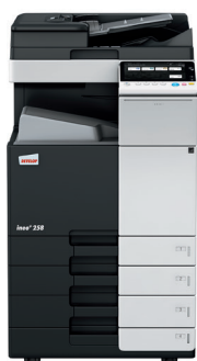
ineo+ 258 cu alimentator de hartie dualscan (DF-704), tava de iesire (OT-506) si caseta de hartie (PC-210)

ineo+ 258 va ajuta sa nu mai depineti de alti furnizori pentru joburile specializate, precum invitatii printate pe hartie groasa, de buna calitate, si sa economisiti astfel timp si bani. ineo+ 258 printeaza pe plicuri, hartie recicla-ta, hartie pre-tiparita, folii transparente, hartie groasa de pana la 300 g/m 2 si multe alte suporturi. Aceste echipa-mente printeaza pe diverse formate, de la A6 la A3+ (SRA3), dimensiuni particularizate definite de utilizatori sau bannere cu lungime de pana la 1.2 metres. Mai mult, numeroasele optiuni de finisare, permit crearea de bro-suri cu pana la 80 de pagini, scrisori pliate in diverse moduri, fise capsate sau facturi perforate. Cu ineo+ 258, aproape orice poate fi produs intern.